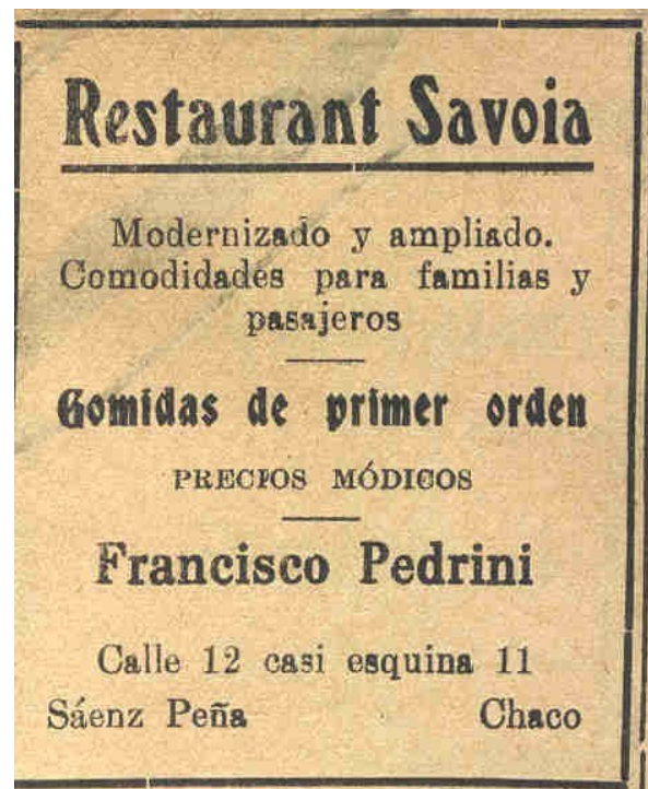
Aviso del 18 de junio de 1932.