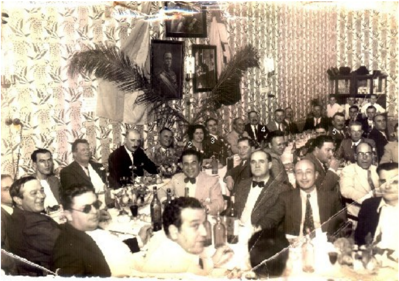
Al dorso dice: "Festeggiando la vittoria delle armi italiane in Etiopía" - 1935. La cena se llevó a cabo en el comedor del Hotel Chaco.