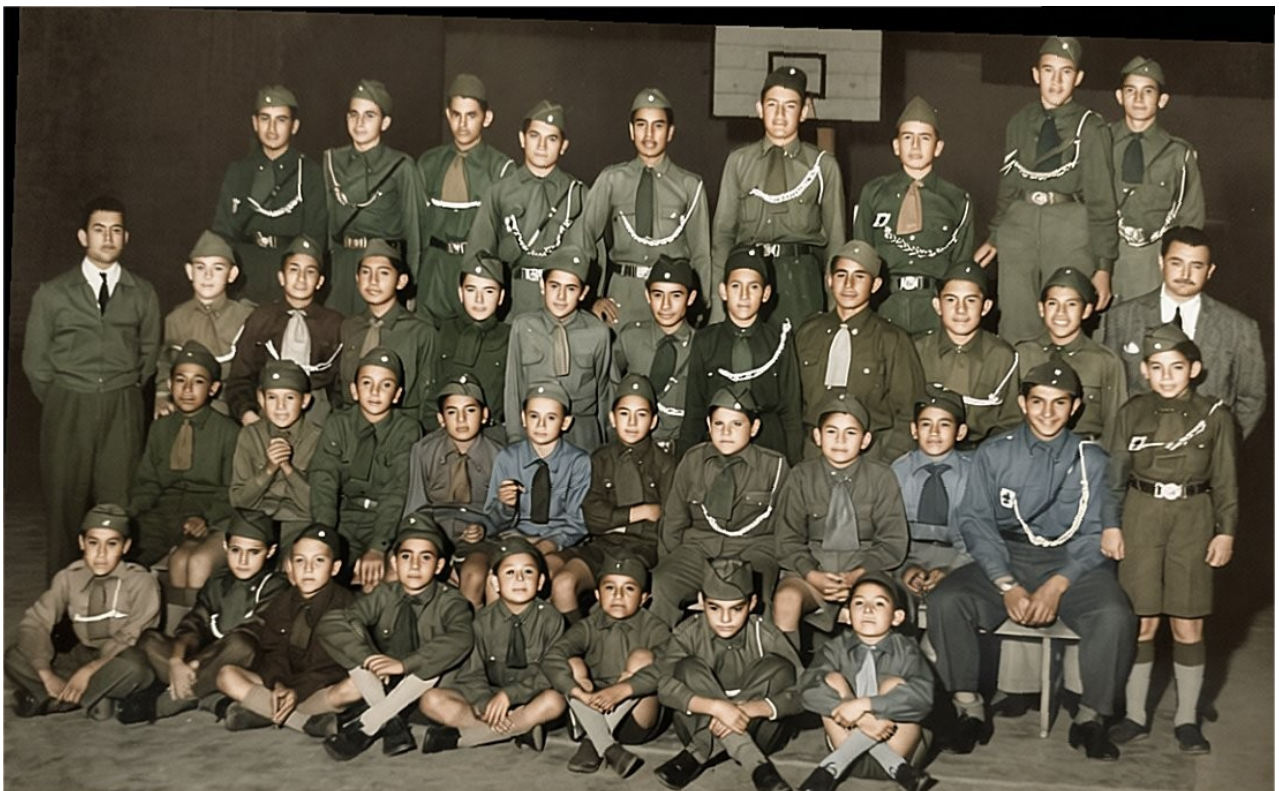
5 de septiembre de 1956. Grupo de Boys Scout saenzpeñense.